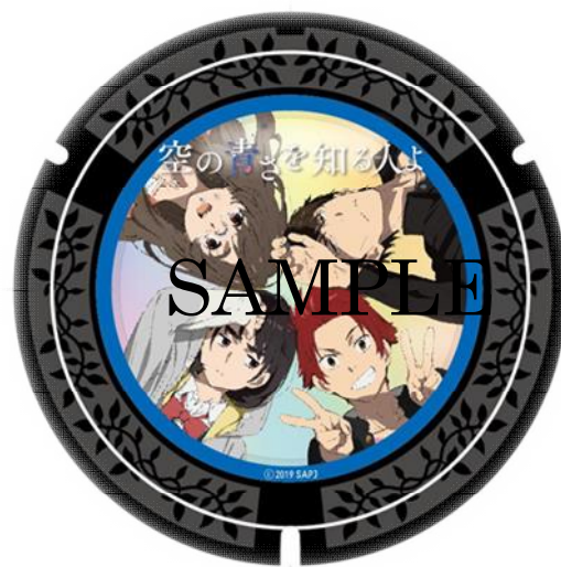
スタンプラリーシートと記念品缶バッジデザイン